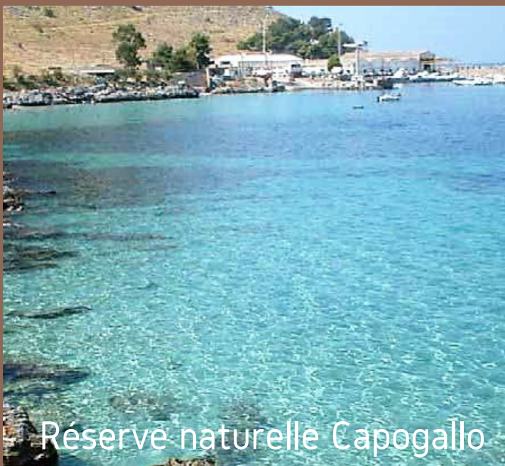
Réserve naturelle Capogallo

On peut y accéder en voiture en 5 minutes seulement ou en bus gratuit, numéro 88, depuis le parking de Barcarello, depuis la Via Tritone, à 5 minutes de marche de la villa.