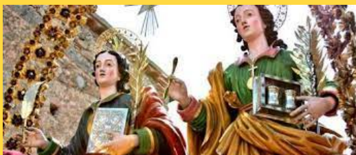
ss cosmo e damiano

Au départ, cette ville était un village de pêcheurs. Il y avait des tours de guet : une construite au 15e siècle et une autre au 16e siècle. Ils faisaient tous deux partie du système d'alerte des tours côtières de Sicile, mais ont été détruits lors de la construction de l'autoroute A29. A Punta Barcarello, il y avait une tour-forte, pour se protéger des pirates et des corsaires. À la fin du XIXe siècle, le village de bord de mer est devenu un quartier résidentiel.